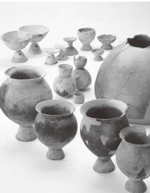
東海系土器 伴堂東遺跡（当研究所蔵）