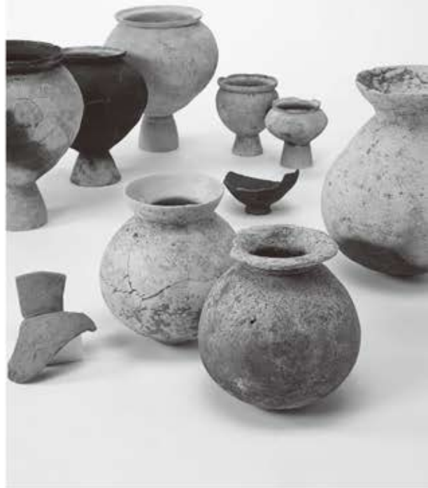
東海系土器 経向遺跡（当館蔵）

さて、経向遺跡から最も多く出土している他地域の土器は東海地方の土器であることが知られてきましたが、これまであまり注目される機会はありませんでした。そこで、本展覧会では最新の研究成果に基づき、奈良県内で非常に多く出土する東海地方の土器や両地域に分布する資料から明らかになった古墳出現期の交流について紹介します。