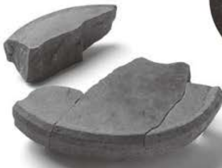
石臼 経向遺跡（当館蔵）