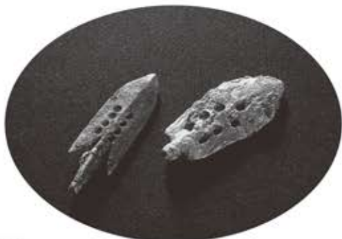
有孔銅鍬（左）調子遺跡（右）住川墳墓群（当研究所蔵）

日時：2014年2月8日（土）10時30分集合 場所：奈良県立橿原考古学研究所附属博物館 特別展示室